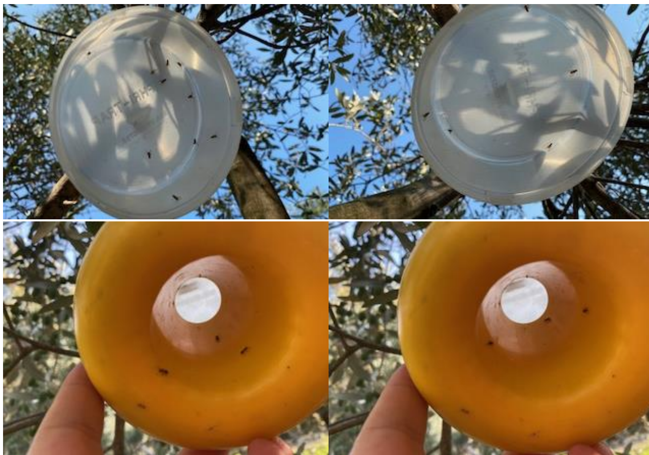
Muve ispod poklopca i oko McPhail klopki