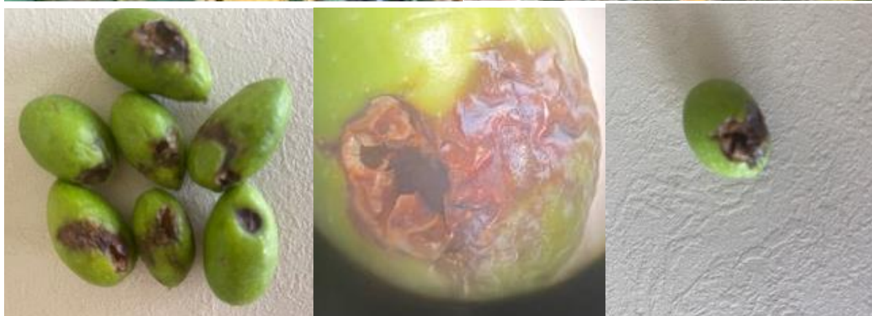
Izgled zdravih i oštećenih plodova